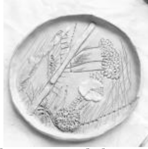
Vajilla I. Fuente de barro cocido. 2020