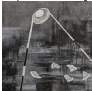
Dibujo II. Carboncillo y acrílico sobre papel. 154 x 150 cms. 2020