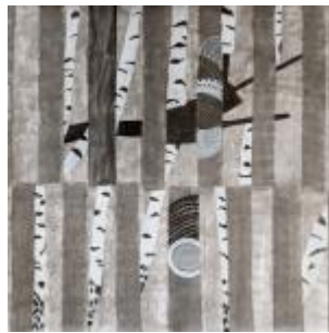
Dibujo I. Carboncillo y acrílico sobre papel. 154 x 150 cms. 2020