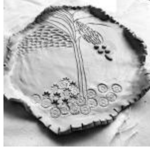
Vajilla II. Fuente de barro cocido. 2020