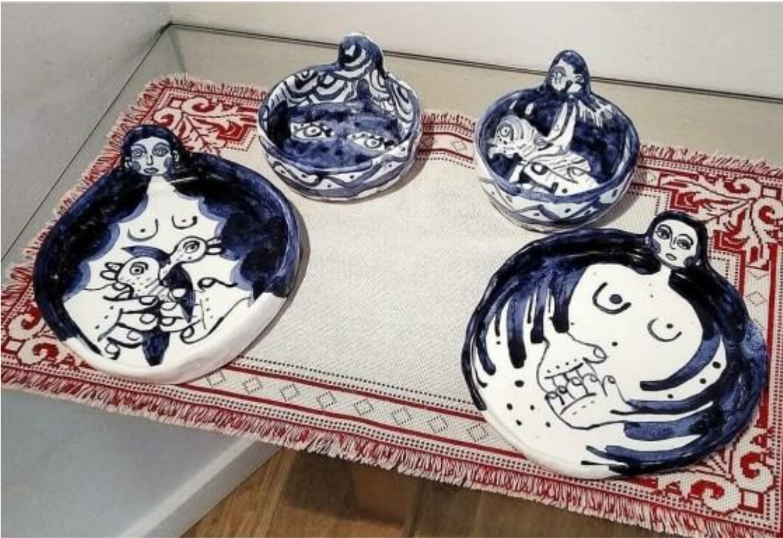
Caldo de puchero (serie de cerámica) Serie "Menú" formada por dibujos y collages