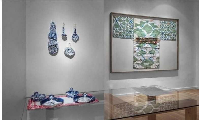
Vista de la exposición Ritual del té (y caldo de puchero)