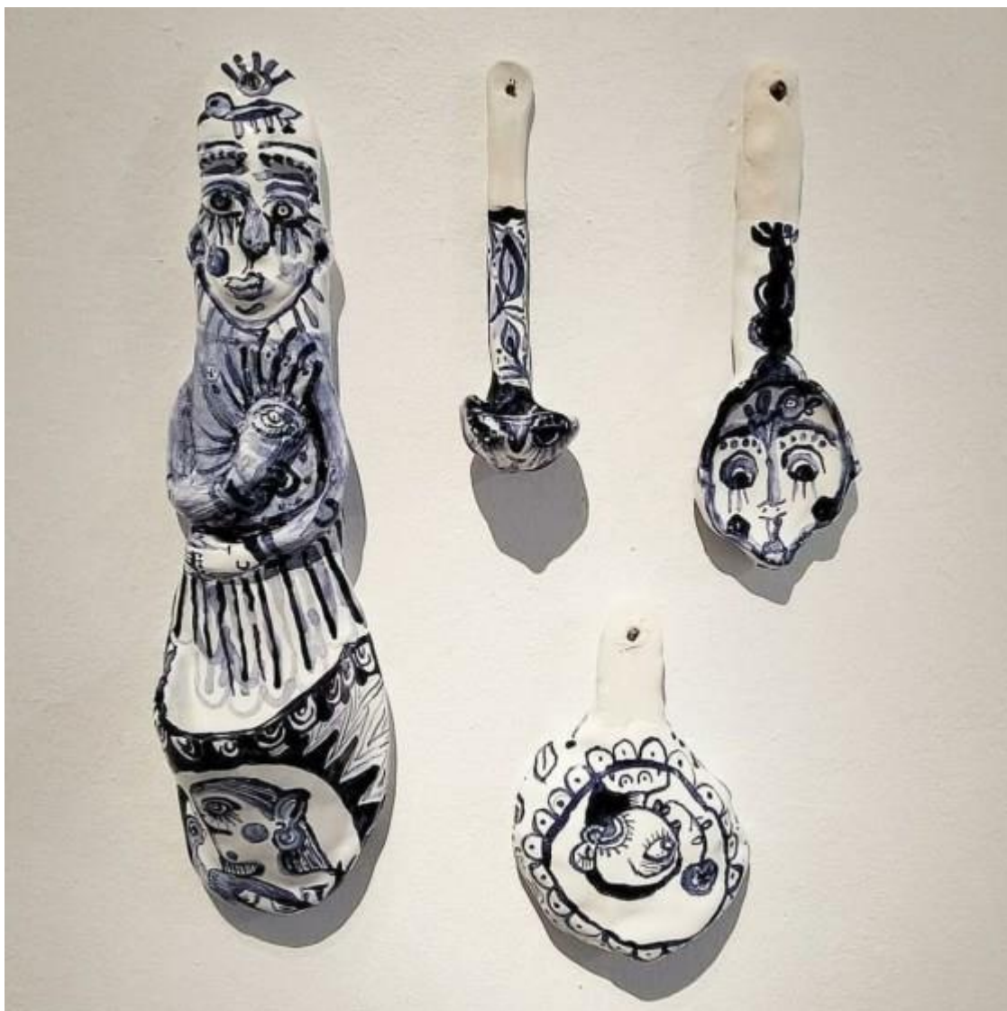
María Bueno, Ritual del té (serie de cucharas de cerámica), 2020