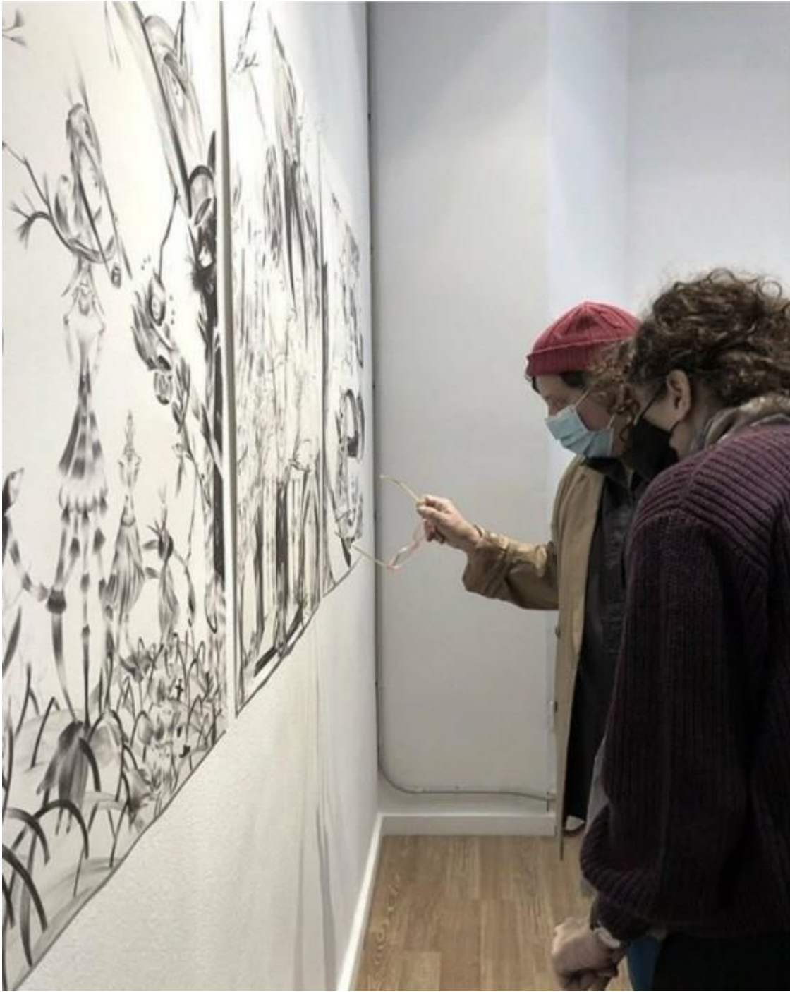
Serie de dibujos Pico y Rama