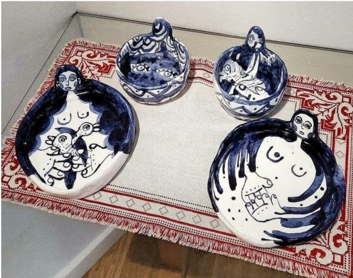
Caldo de puchero (serie de cerámica)