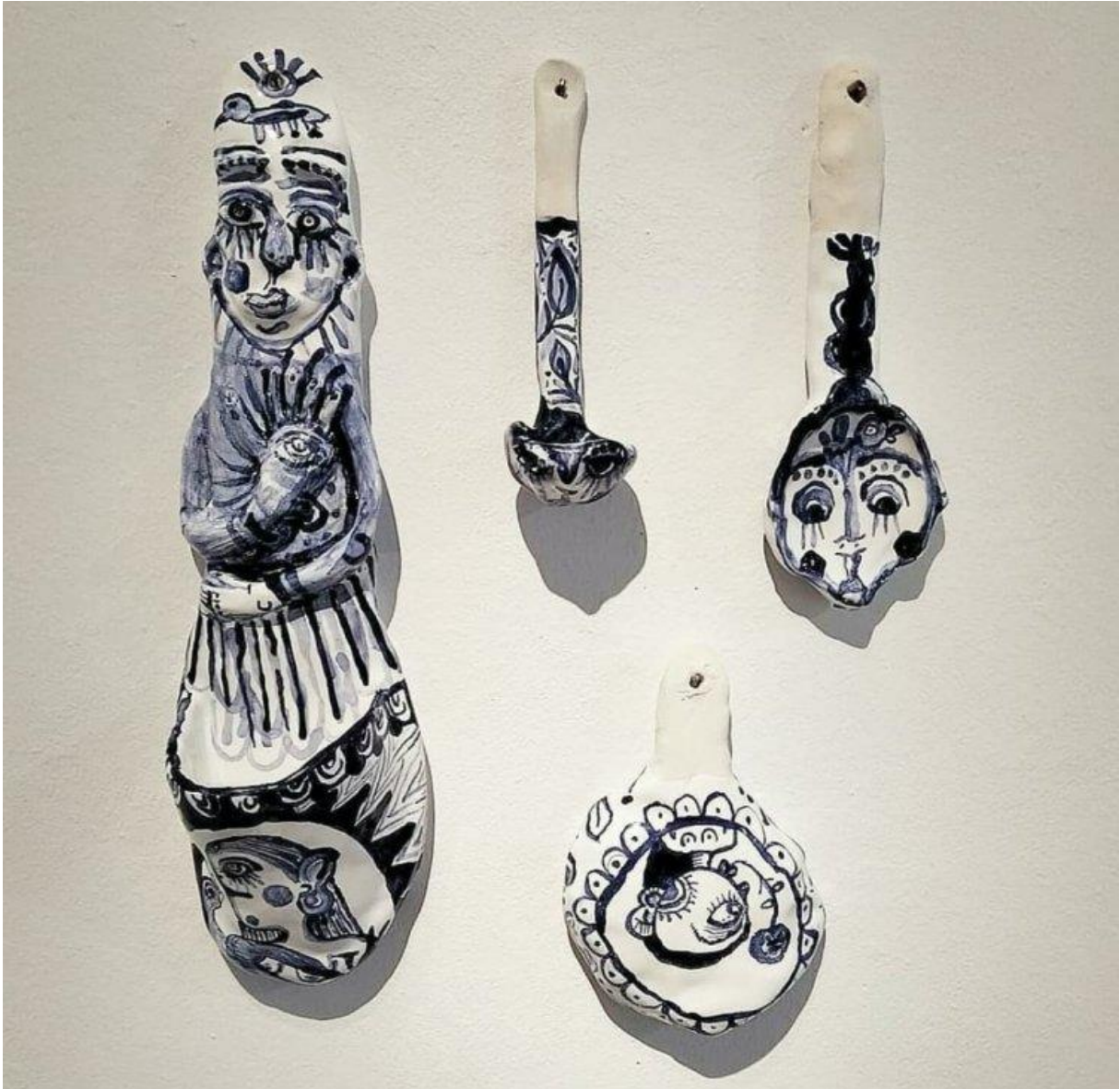
Ritual del Té (serie de cucharas de cerámica).